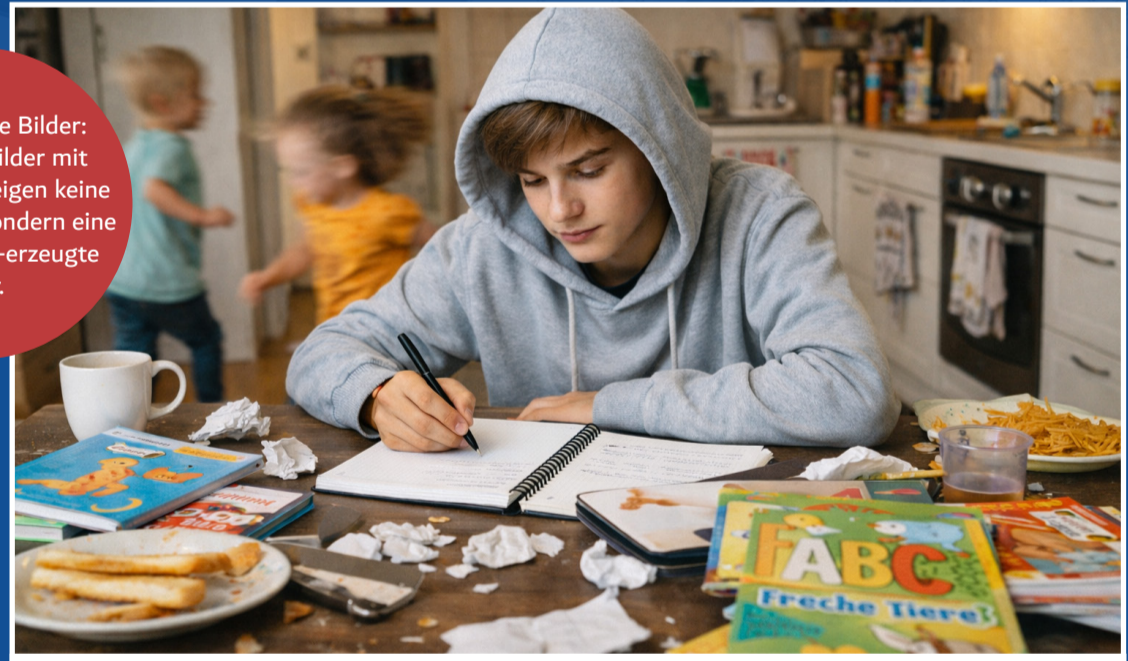
Während die einen ein eigenes Zimmer haben und in Ruhe lernen können, haben andere keine Rückzugsmöglichkeit. Sie lernen mitten im Familientrubel.

KI-Generierte Bilder: Die beiden Bilder mit dem Schüler zeigen keine reale Person, sondern eine vollständig KI-erzeugte Figur.