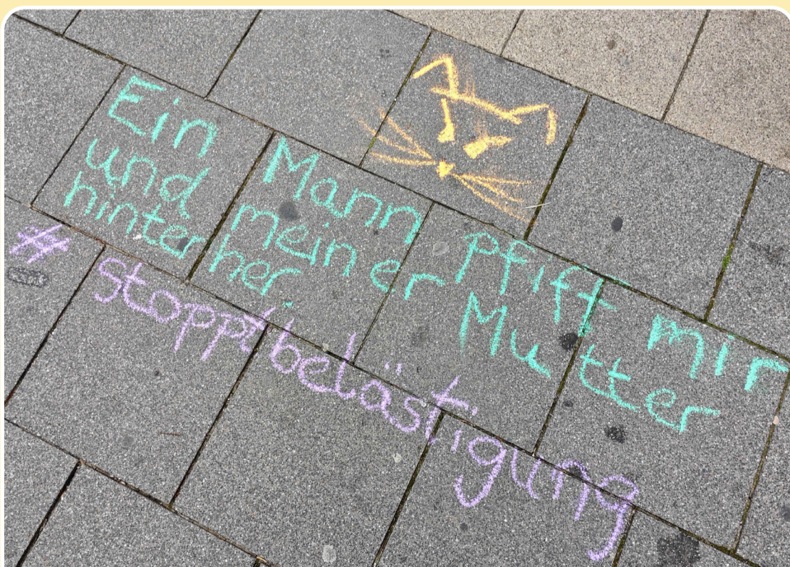
Belästigung fängt oft schon mit kleinen Gesten an.

Kommentare wie „Hey, du geile Schnecke.“ seien gang und gäbe. Vom Begriff „Catcalling“ sei hingegen kaum die Rede. Das könnte auch daran liegen, dass anzügliche Bemerkungen in der Schule aus dem Catcalling-Raster fallen: Während sich Catcaller in der Öffentlichkeit hinter Anonymität verstecken, ist die Schule ein geschützter Raum; Schülerinnen und Schüler sind untereinander keine Fremden. Das macht anzügliche Kommentare im Klassenzimmer weniger zu spontanem Catcalling, sondern eher zu einer direkten Belästigung, die so auch erneut auftreten kann.