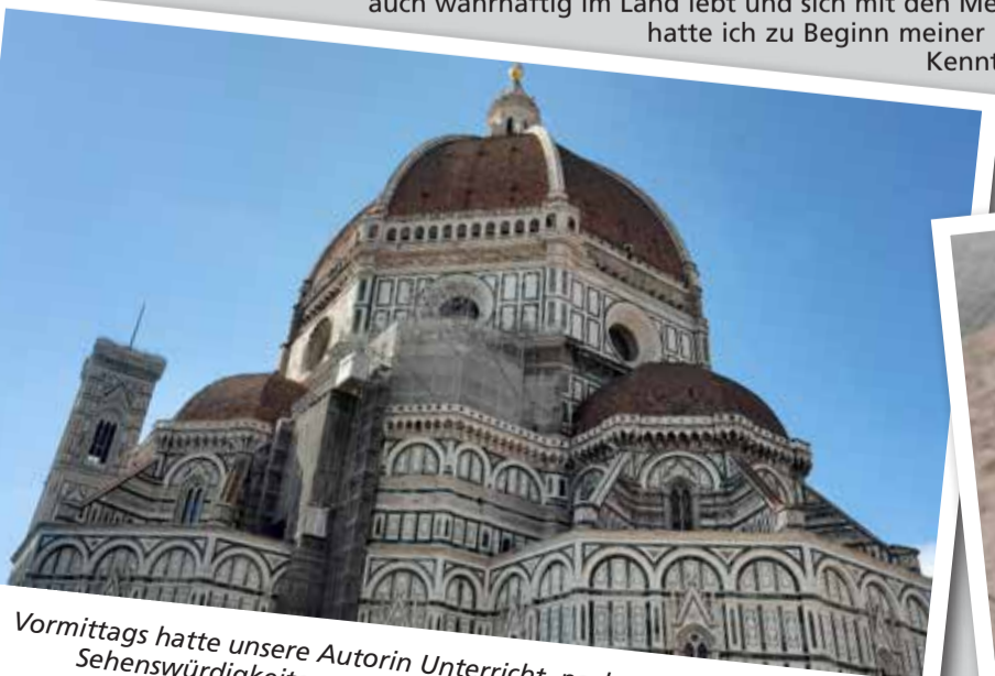
Vormittags hatte unsere Autorin Unterricht, nachmittags schaute sie sich Sehenswürdigkeiten an – beispielsweise den Florentiner Dom.

Generell lernt man die Sprache schnell, wenn man nicht nur den Sprachunterricht genießt, sondern auch wahrhaftig im Land lebt und sich mit den Menschen dort unterhält. So hatte ich zu Beginn meiner Reise keinerlei Italienisch-Kenntnisse, doch mit der Zeit verstand ich immer mehr der Gespräche