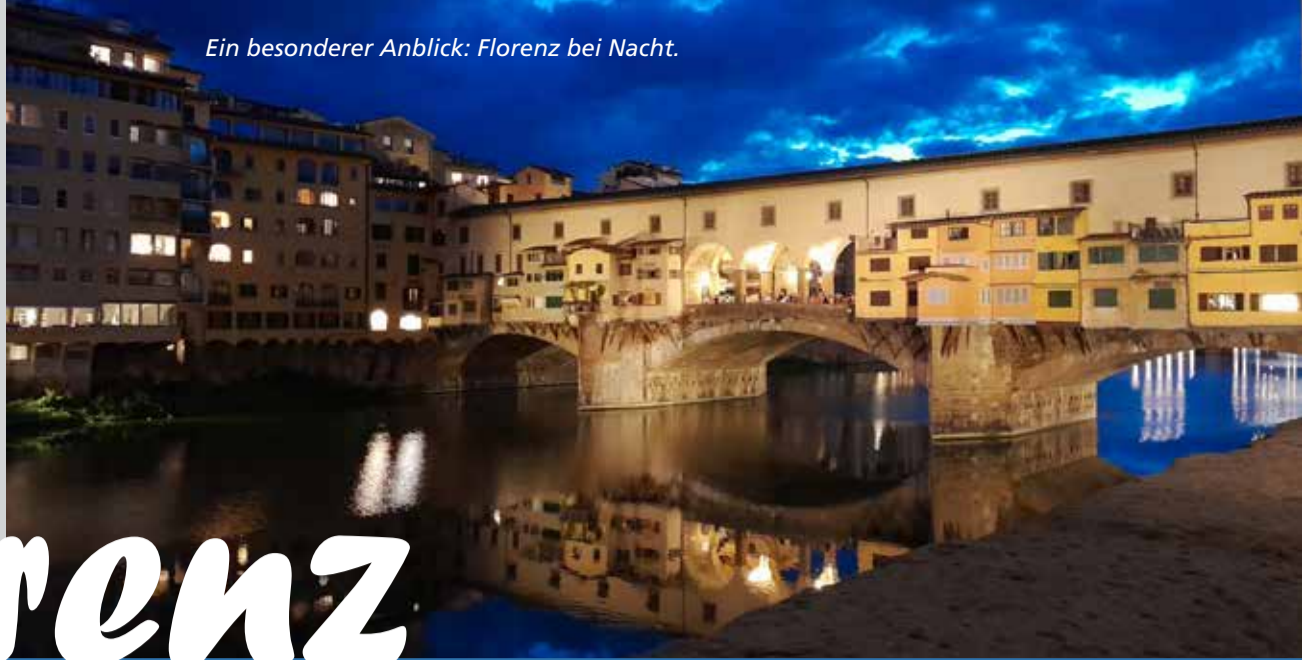
Ein besonderer Anblick: Florenz bei Nacht.

um mich herum und nach den vier Wochen konnte ich stolz mein A1-Zertifikat in den Rückreise-Koffer packen. Außerdem kamen in Florenz meine Englisch-Kenntnisse zum Einsatz: Der Italienisch-Unterricht mit englischer Übersetzung erscheint erst einmal als Wagnis, ist aber sehr bereichernd. Ich hatte mich für ein Sprachprogramm entschieden, bei dem nur vormittags Unterricht stattfand, da ich die Nachmittage für Ausflüge nutzen wollte. Aber natürlich kannst du auch einen Intensivkurs mit Unterricht am Vor- und Nachmittag buchen, wenn du noch tiefer in die Sprache eintauchen möchtest. Am Nachmittag bot Linguaviva zudem Aktivitäten an: Neugierig auf eine Stadtführung, die Uffizien, die Basilika Santa Croce oder doch lieber einen Trip zum Piazzale Michelangelo? Für jede und jeden ist etwas dabei!