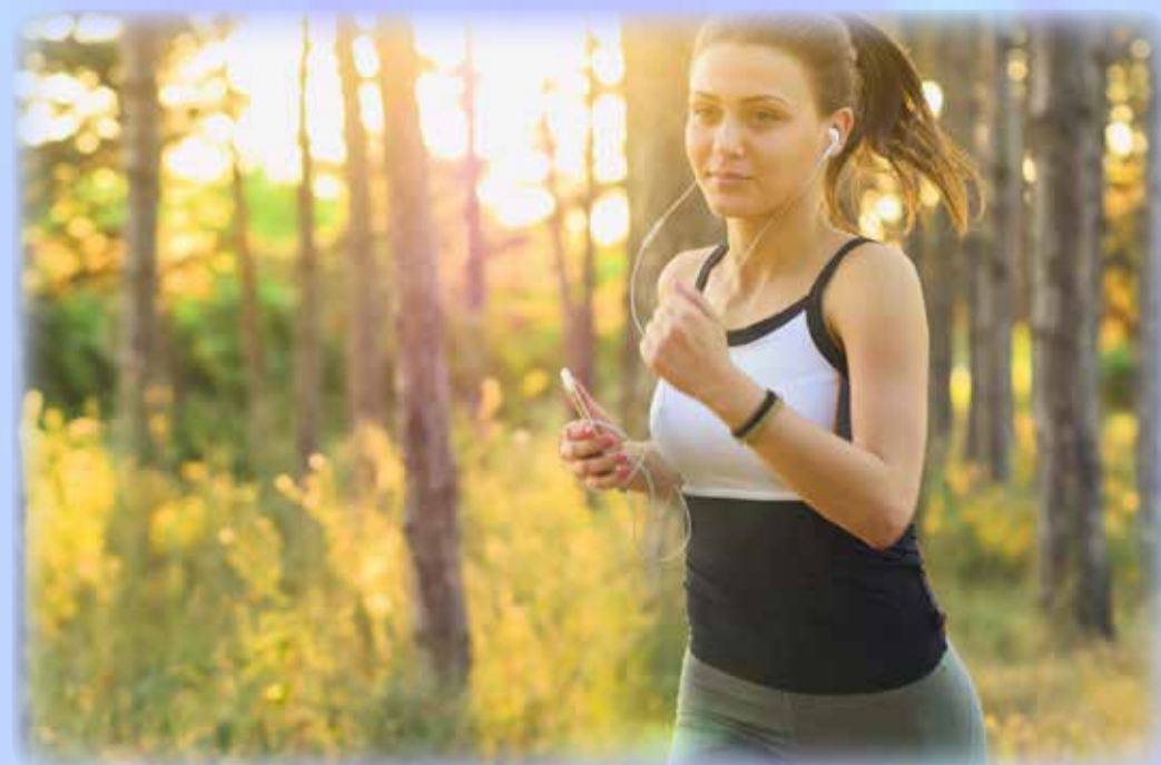
Ob beim Joggen, Putzen, Autofahren oder auf dem Sofa: Mit einem Podcast auf den Ohren lässt es sich prima entspannen.